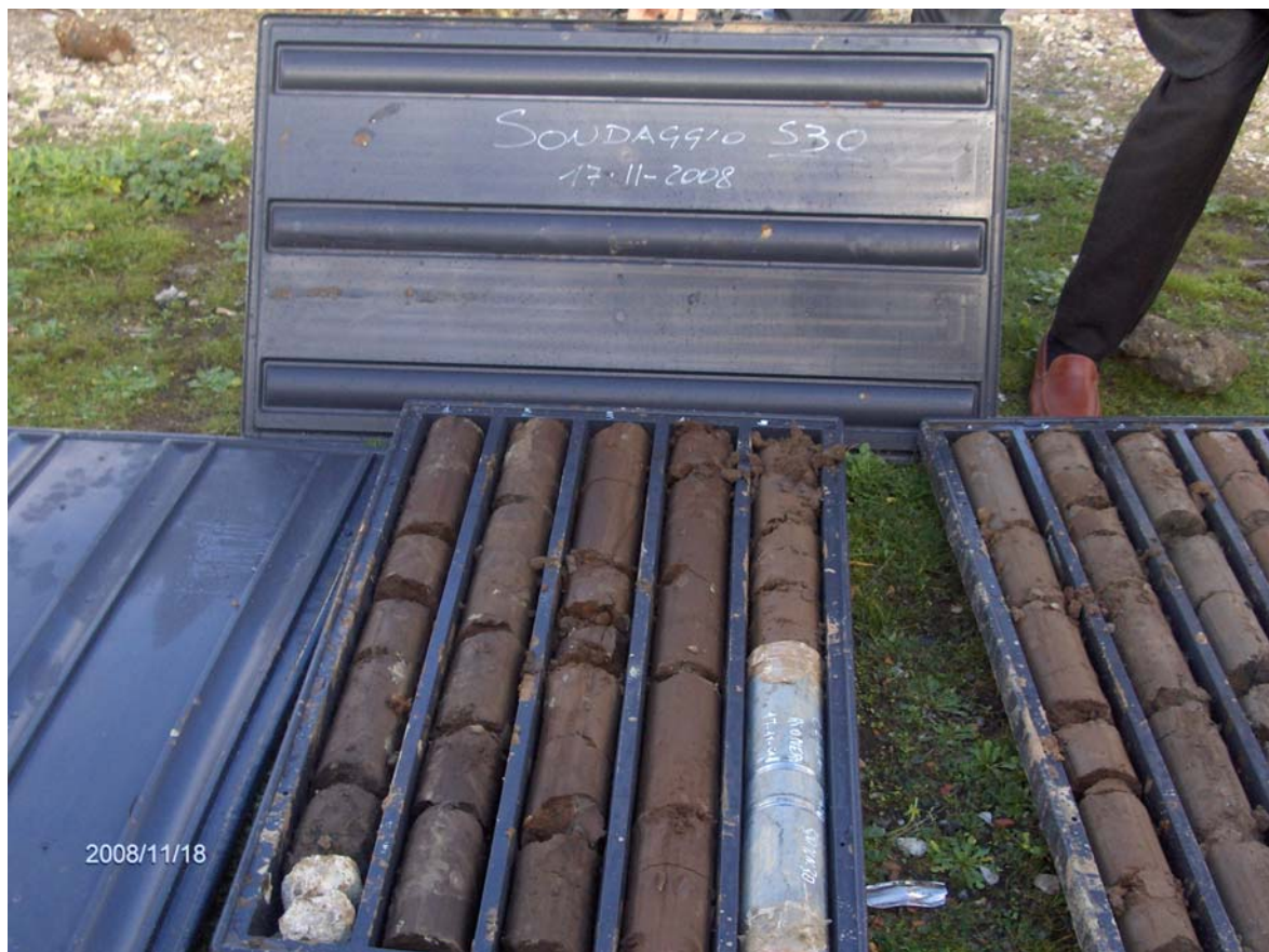
Figura 3: cassette catalogatrici del sondaggio S30