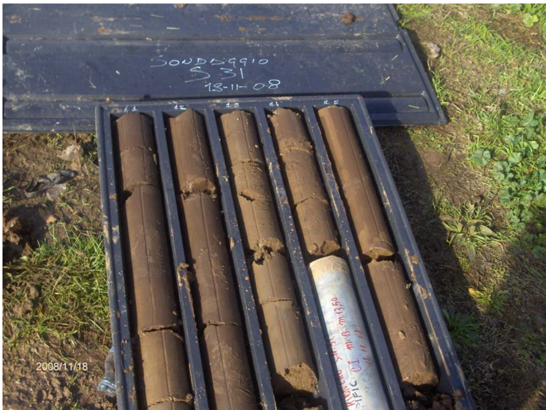
Figura 6: Cassetta catalogatrice del sondaggio S 31