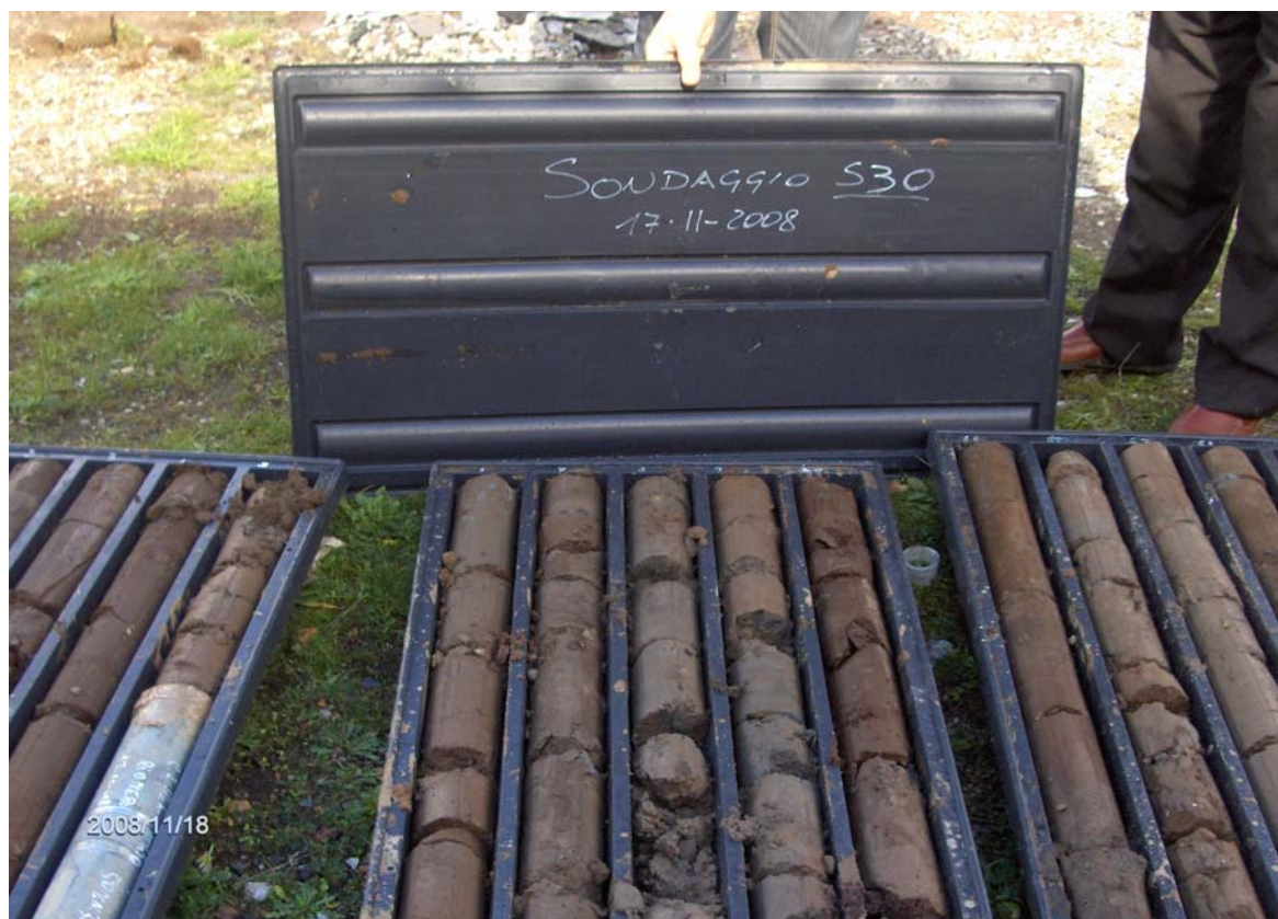
Figura 4: Cassette catalogatrici del sondaggio S30