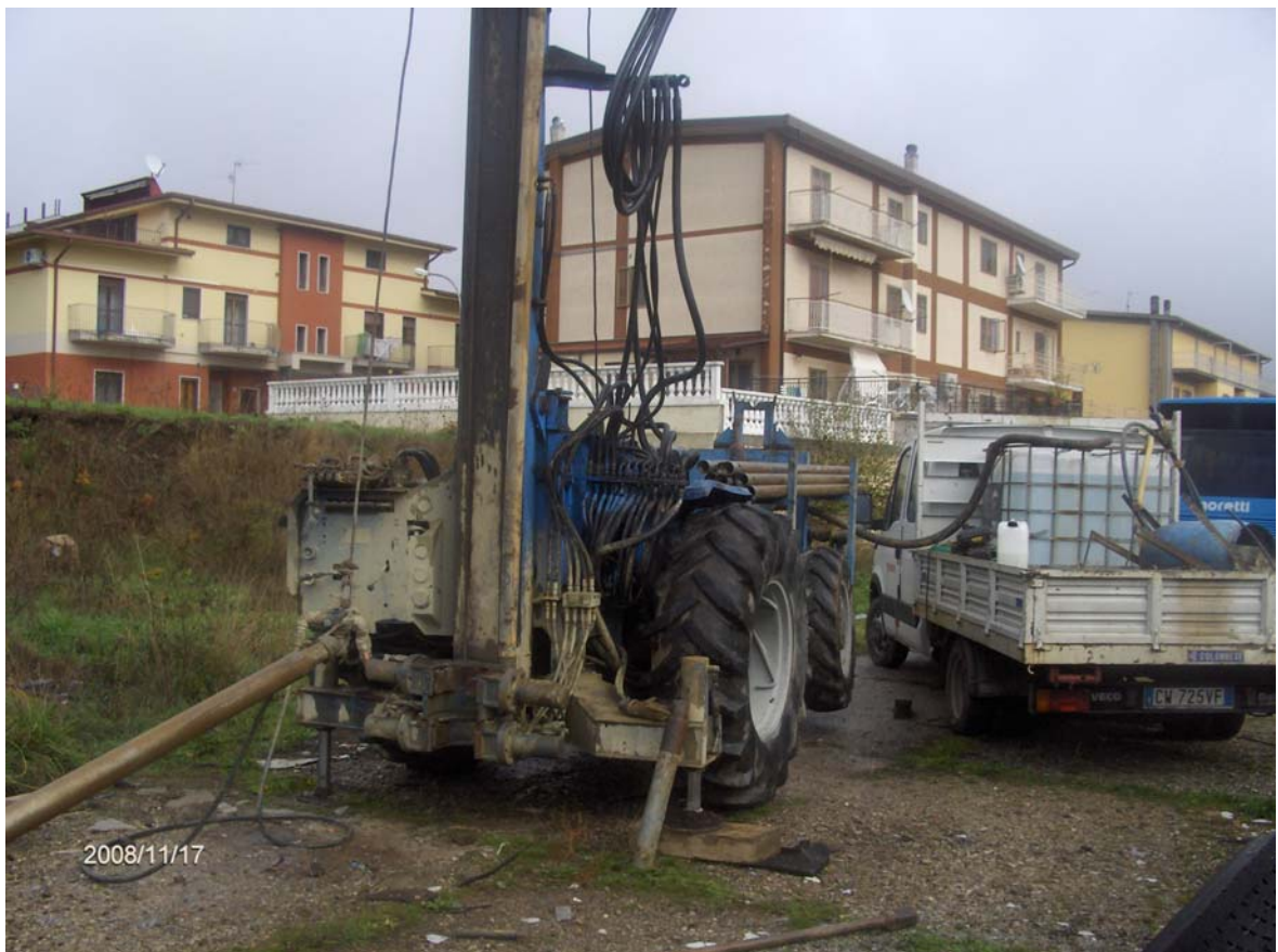
Figura 2: Esecuzione del sondaggio S30