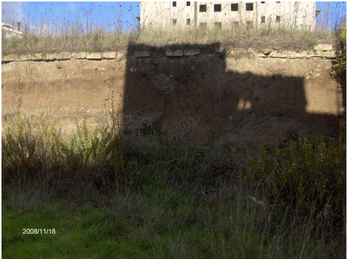
Figura 1: Affioramento dei terreni vulcanici nell'area in studio