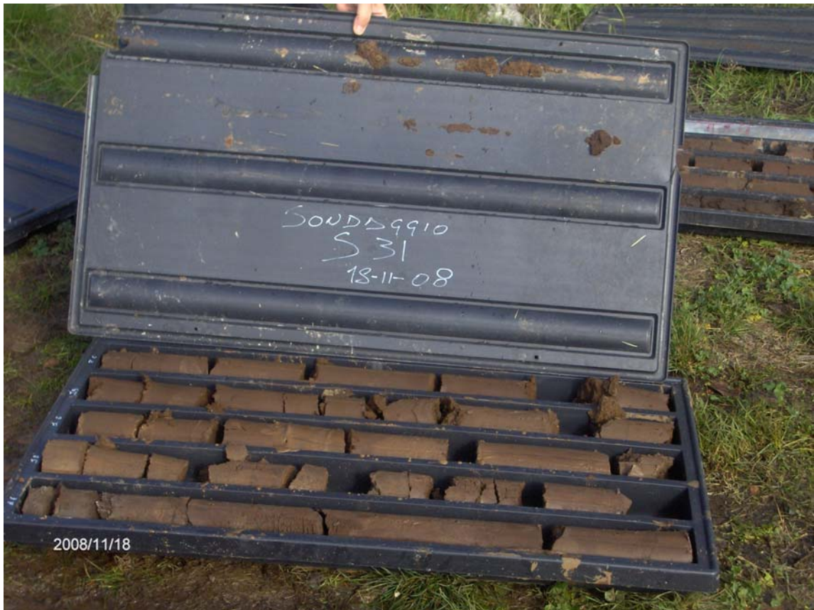
Figura 7: cassetta catalogatrice del sondaggio S31