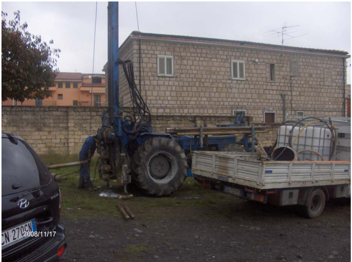
Figura 5: Esecuzione del sondaggio S31