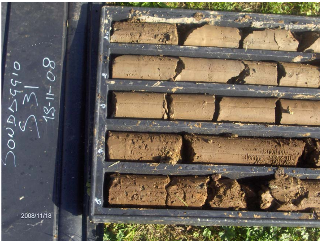
Figura 8: cassetta catalogatrice del Sondaggio S31